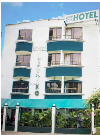
Imagen No.1: Fachada Hotel Lord Star – Santiago de Cali

DIRECCIÓN: Calle 9 No. 56 - 240, Barrio Camino Real TELEFONOS: (2) 5132562/61 - 312 7471052