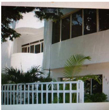
Imagen No.1: Fachada Hotel Lord Toscan – Santiago de Cali

DIRECCIÓN: Calle 9 No. 62 - 49, Barrio Camino Real, TELEFONOS: 310 435 7939